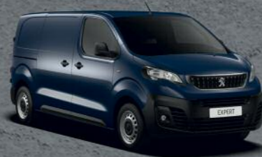
Plava Imperial (2)