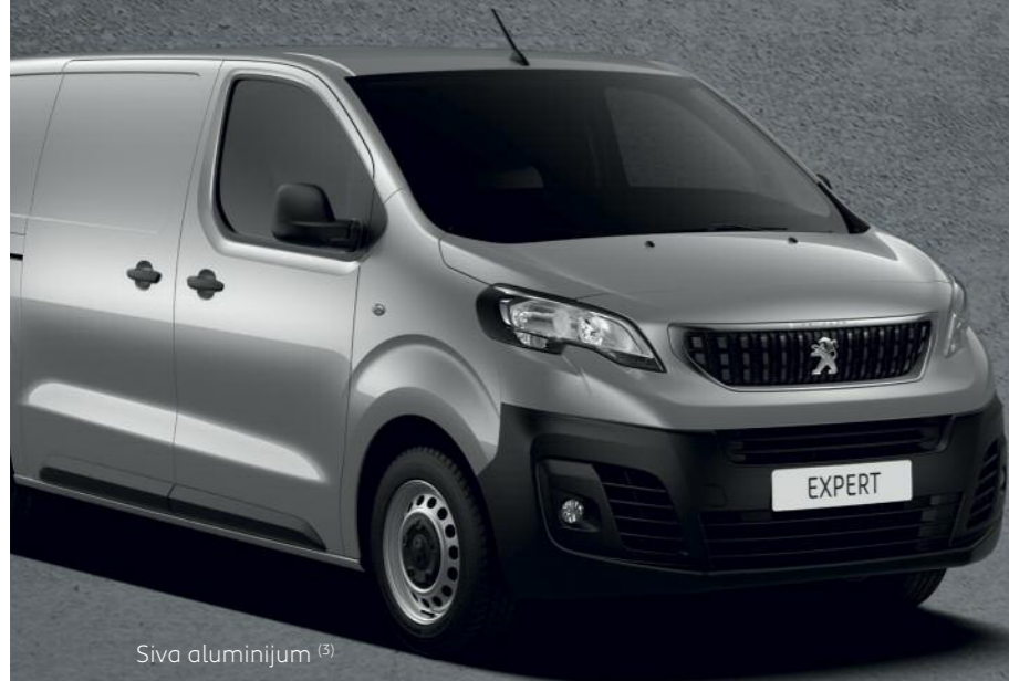
Siva aluminijum (3)