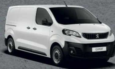
Bela Banquise (2)