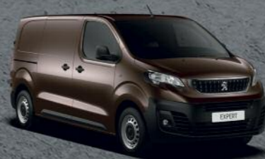
Braon Rich Oak (3)