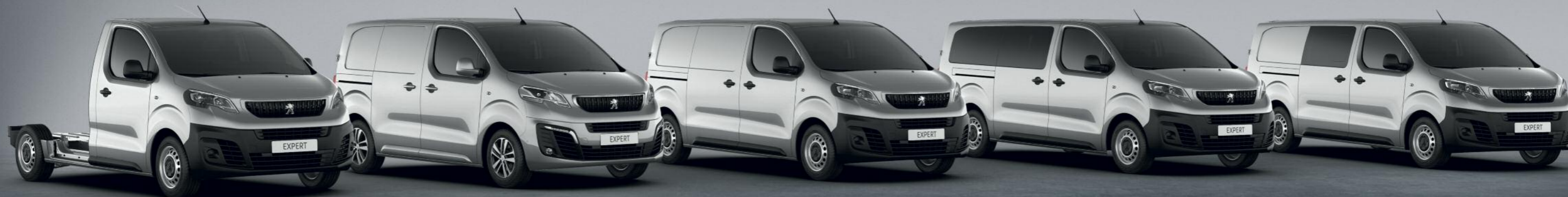
Pod kabina, Kompaktni furgon, Furgon standard, Kombi do 9 mesta i Produžena kabina