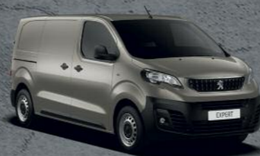
Silky Gray (3)