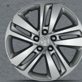
Felna Phoenix 17" (4)