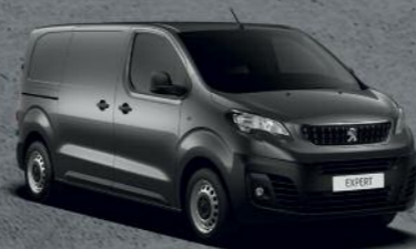
Siva Platinum (3)