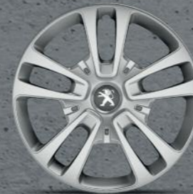
Ratkapna San Francisco 16" (4)