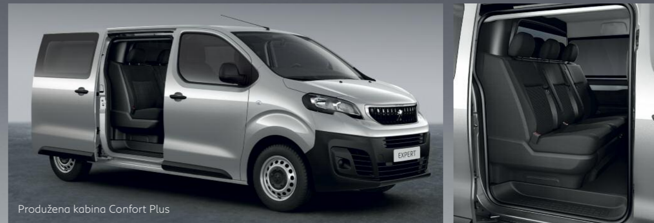
Produžena kabina Confort Plus

*Dostupno na verzijama fiksirana produžena kabina