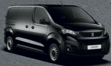
Crna Onyx (1)