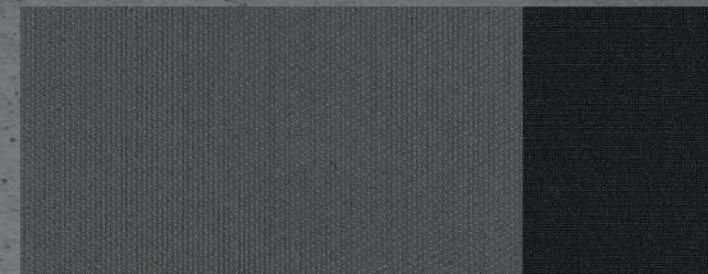
Tkanina Curitiba Monoton Bise