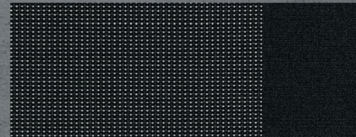
Tkanina Curitiba Triton Meltem (5)