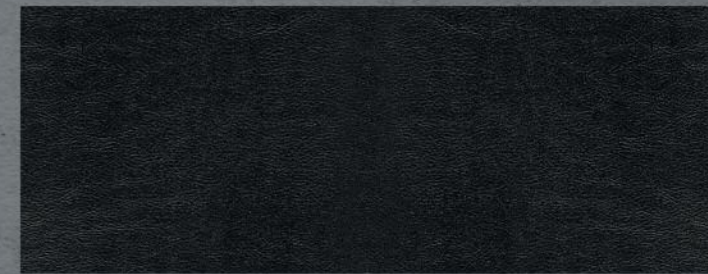
TEP Carla crna (5)