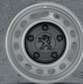
Crni ili sivi poklopac 16" i 17" (4)