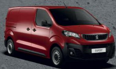
Crvena Ardent (1)