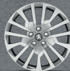
Ratkapna Miami 17" (4)